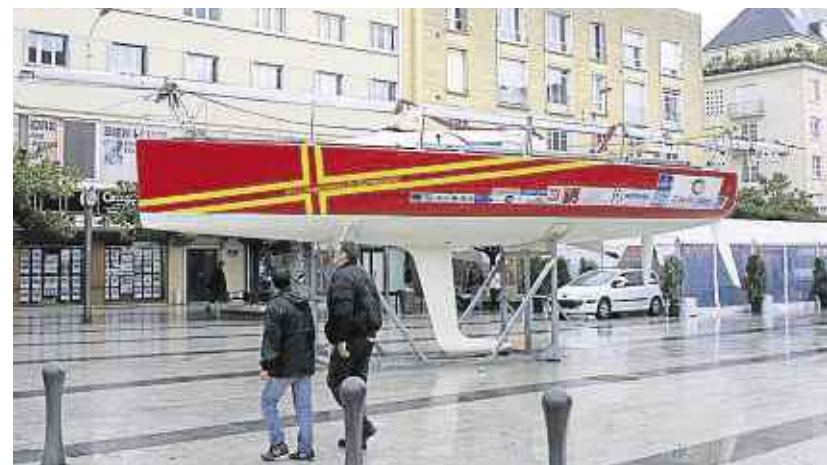
La place du Théâtre a le goût du grand large, avec l'installation, mardi, du bateau symbole de ces quatre jours de sensibilisation à la protection des rivages.

La place du Théâtre prend le large à partir de ce mercredi, et jusqu'à samedi, avec « De la terre à la mer ». Quatre journées sont consacrées à la protection du littoral dans le cadre d'une opération de sensibilisation menée par l'Agence de l'eau Seine-Normandie et Caen-la-Mer. Ateliers pédagogiques, rencontres avec des